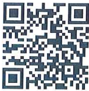
<參觀展覽預先報名>

Fire&Safety 展覽官網：secutechfiresafety.tw.messefrankfurt.com